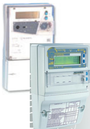
2 contacts tarifaires compteur Jaune